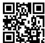
Ersatzhaltestelle Richtung Stade

Richtung Hamburg Hbf: Verlassen Sie den Bahnsteig auf der Westseite. Biegen Sie nach rechts ab und folgen Sie der Hannoversche Straße, bis Sie an der Moorstraße sind. Biegen Sie nach links ab und folgen Sie dem Straßenverlauf bis zur Ersatzhaltestelle.